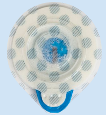
Liner di rivestimento stampato