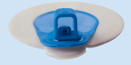
A = Connettore 4 mm