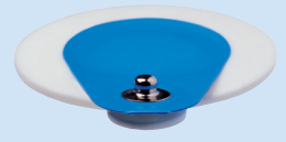
S = Bottone