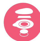
Sensore in argento